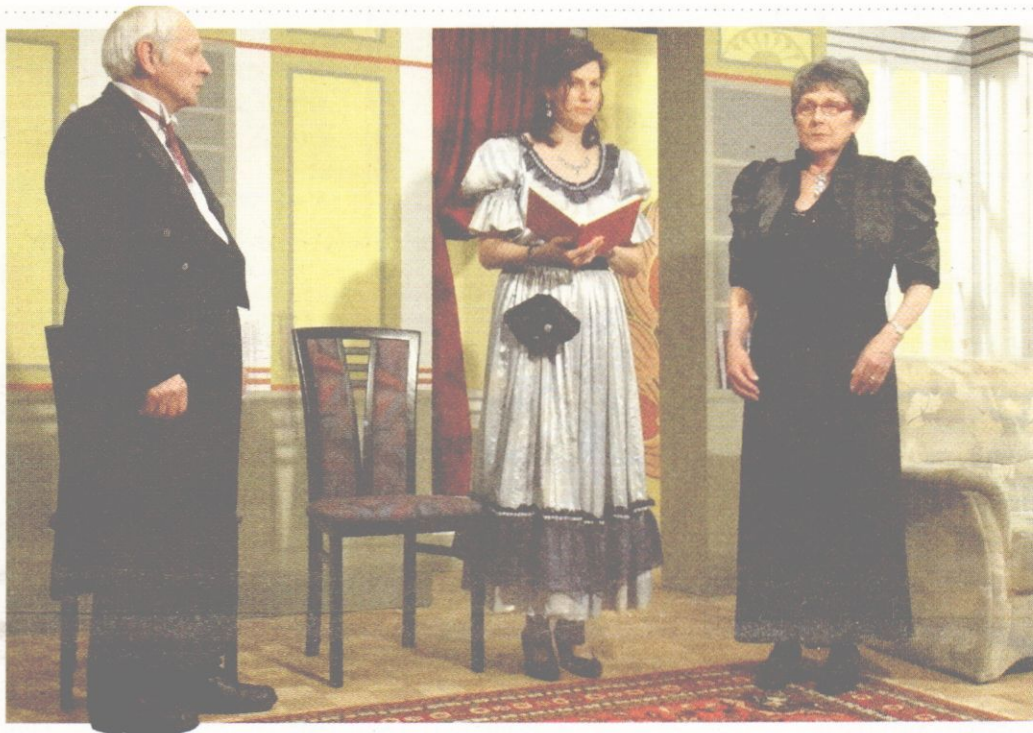
Bei der Seniorenbühne kommen auch immer wieder junge Talente zum Einsatz