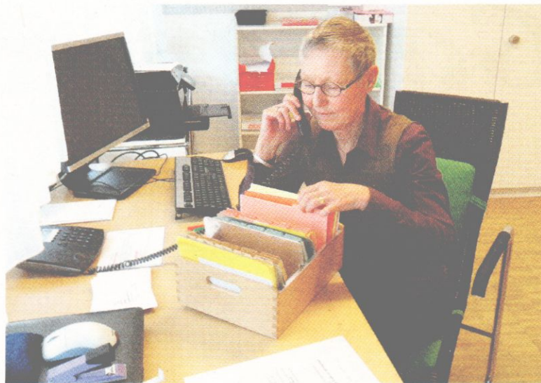
Die Vermittlungsstelle des VSeSe an der Bahnhofstrasse 1

besteht die Möglichkeit, als Klassenhilfe in der Schule die Lehrkräfte zu unterstützen. Eines möchte der Vereinspräsident aber ganz klar festhalten: «Wir arbeiten mit Einrichtungen wie Pro Senectute, Altersbetreuung Vechigen/Worb und der Kirchgemeinde zusammen und wollen diese in keiner Weise konkurrenzieren.